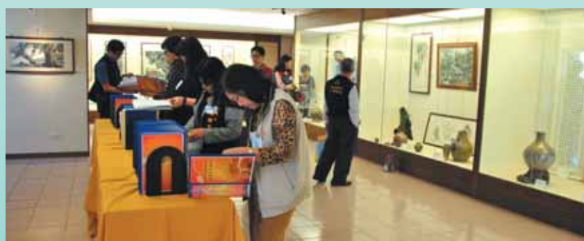
▲各區調解委員翻閱南屯區調解業務資料。