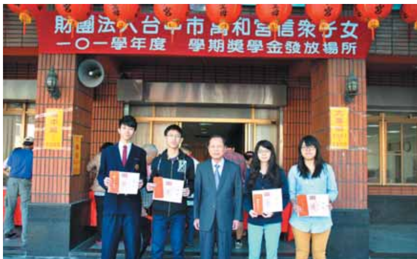
▲蕭董事長勉勵同學們繼續爭取好成績。

萬和宮信眾子女101學年度獎學金，多達1709人獲獎，合計704萬餘元，11月23日上午9點起開始發放。此次獲獎，包括國中538人、高中職423人及大專院校748人。國中每人3000元、高中職4000元、大專院校5000元。