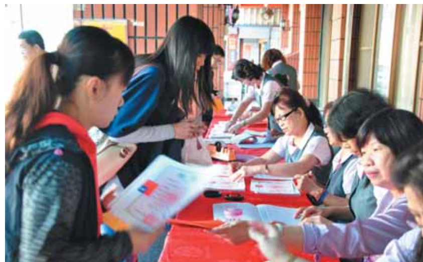
▲萬和宮發放獎學金，人潮不斷。

61校及國中84校），除金門、馬祖及台東縣外，遍及台灣地區及澎湖離島，包括台大、政大、交大、清大及北一女等多所名校，以及離島澎湖科技大學等，足以證明，媽祖信眾子女遍佈各地區，媽祖聖恩廣庇四方；且獲獎同學就讀學校遍及澎湖離島，也不乏精通詩書琴藝，才藝雙全，得獎可謂實至名歸。