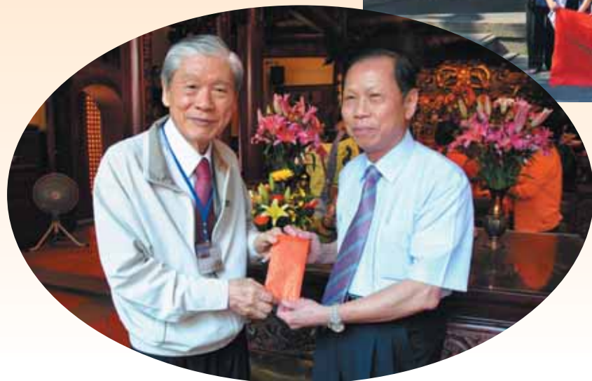
▲林氏宗廟董事長、總統府資政林柏榕致贈香火錢紅包。