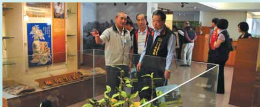
▲各區調解委員參觀麻茅文化館及創意藝廊。