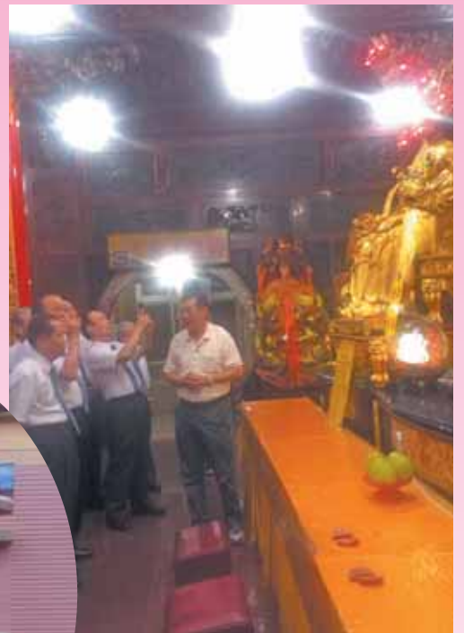
▲董監事觀賞南方澳南天宮的金媽祖神像。