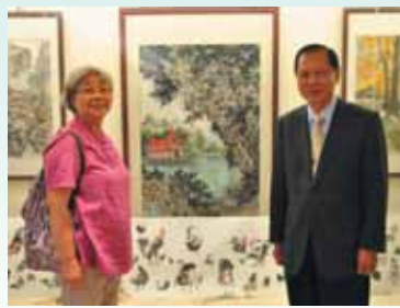
▲董事長與展覽者合影。