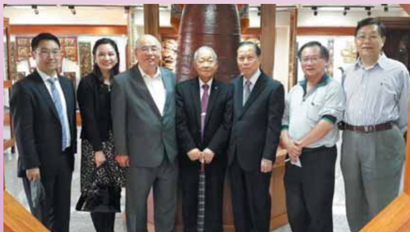
▲前法務部長蕭天讚說，萬和宮典藏的文物最豐富。