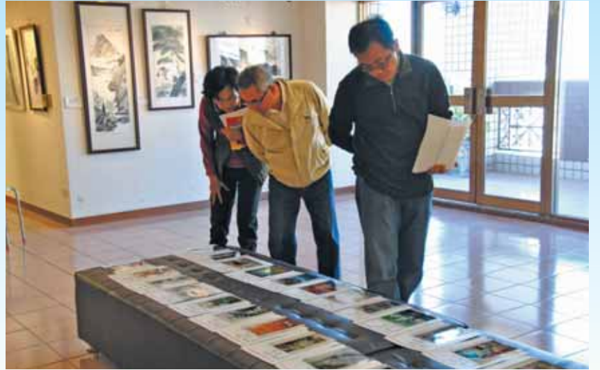
▲評審委員仔細評鑑參賽作品照片。