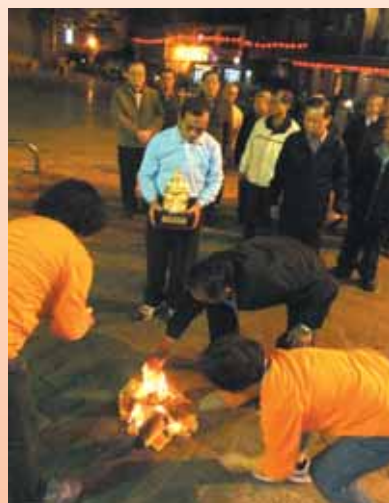
▲萬和宮董監事，完成文昌帝君祖廟謁祖拜祭儀式的「過火」儀式。

文昌帝君的陪祀神「天鸞」與「地啞」，書僮打扮看來憨厚。據指出，讀書人的文運與仕途，都掌握在文昌帝君手中，天鸞與地啞在側，表示天機不洩漏。