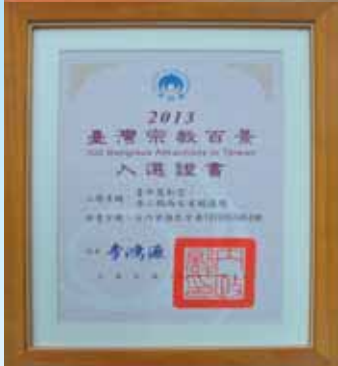
▲萬和宮獲內政部頒發的宗教百景入選證書。