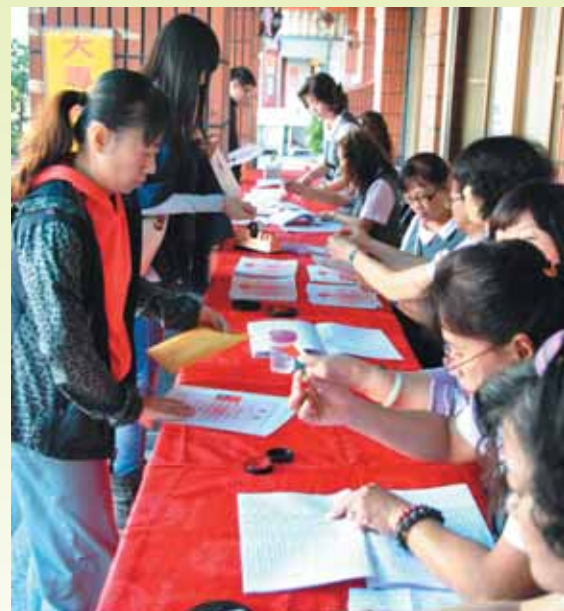
▲志工們仔細核對獎學金名冊資料。