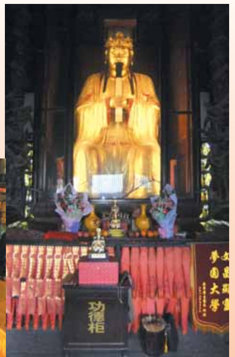
▲四川梓潼祖廟的文昌帝君神像。

七曲山大廟始建於晉朝的廟宇，在歷經唐、宋、元、明、清數代修造和擴建以後，整個大廟一萬二千多平方米，為文昌宮和關帝廟的總稱，由23座不同時期的建築群所組成七曲山大廟。